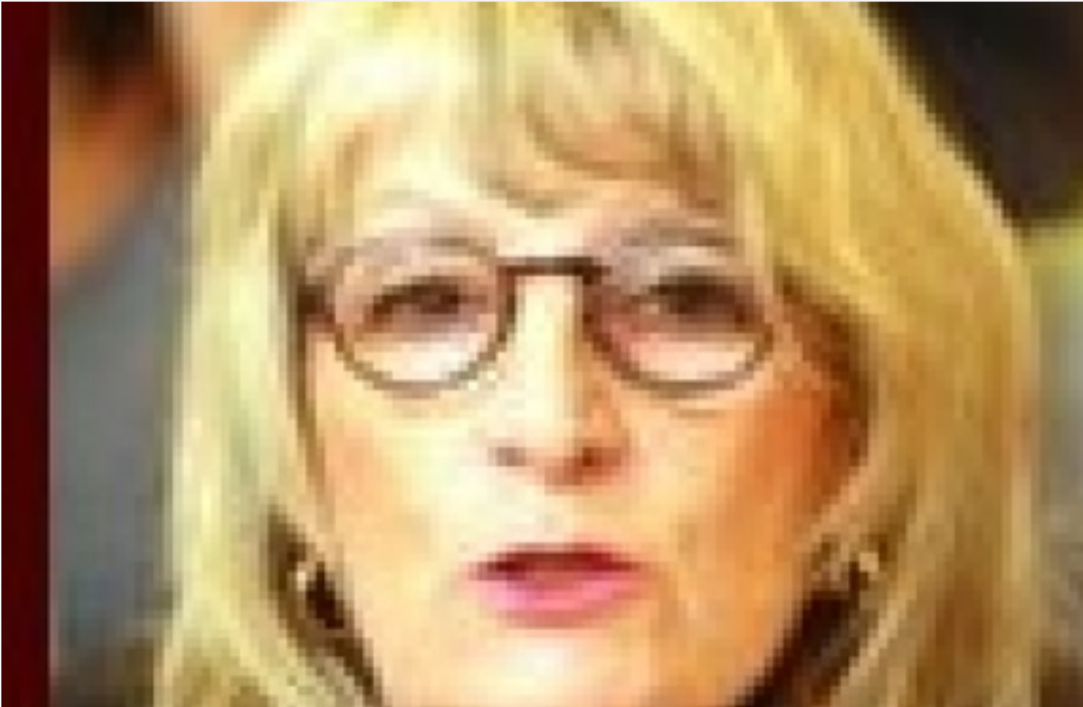
La République, la gauche