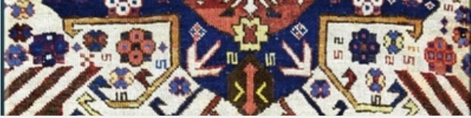
Tapis des peuples nomades du Caucase à Saint-Cyprien