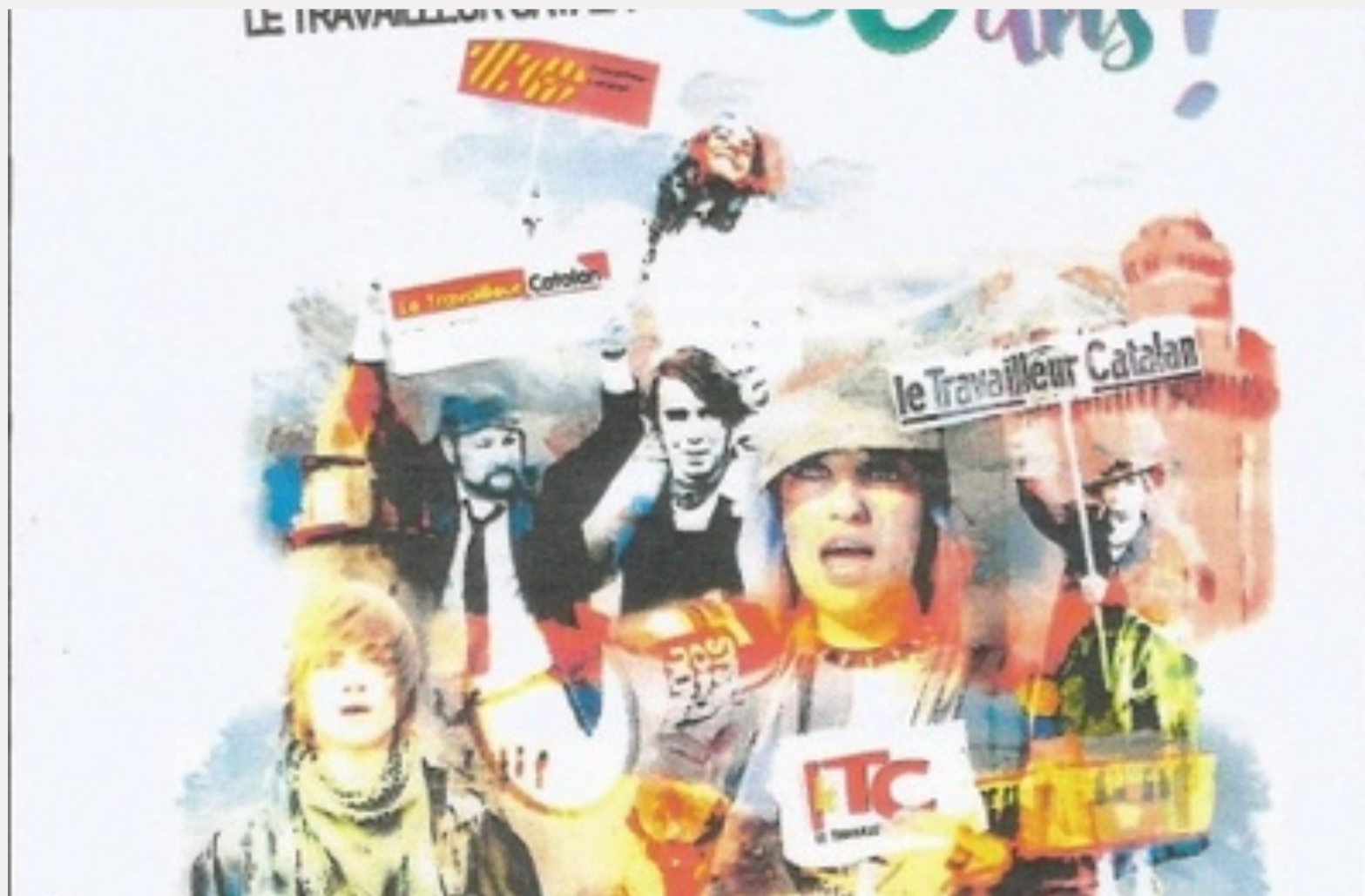
Le Travailleur Catalan a 80 ans!