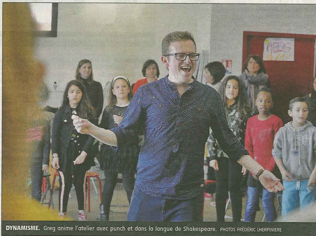
DYNAMISME. Greg anime l'atelier avec punch et dans la langue de Shakespeare.

Des acteurs au même titre que les professionnels, dont les prestations seront, par conséquent, payantes. « C'est une fa-