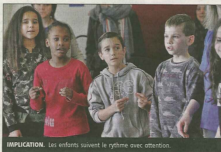
IMPLICATION. Les enfants suivent le rythme avec attention.