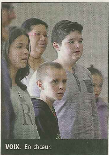
VOIX. En chœur.

Derrière l'initiative du Festival, un enjeu de société et d'actualité : l'accès à la culture pour tous.